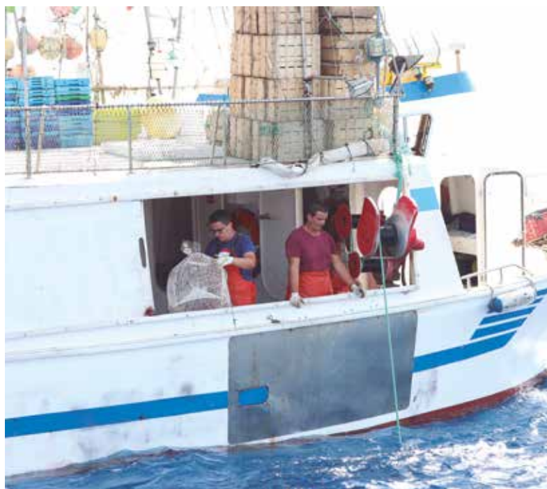
La captura de quisquilla se realiza con nasa

Desde 2003 la flota sigue cayendo en picado, desde Europa obligaron a reducir embarcaciones y a realizar cambios en las que querían seguir pescando, y eso supuso el endeudamiento de casi todos los armadores “el que menos, debía la mitad del coste del barco para luego ser testigo de los vaivenes