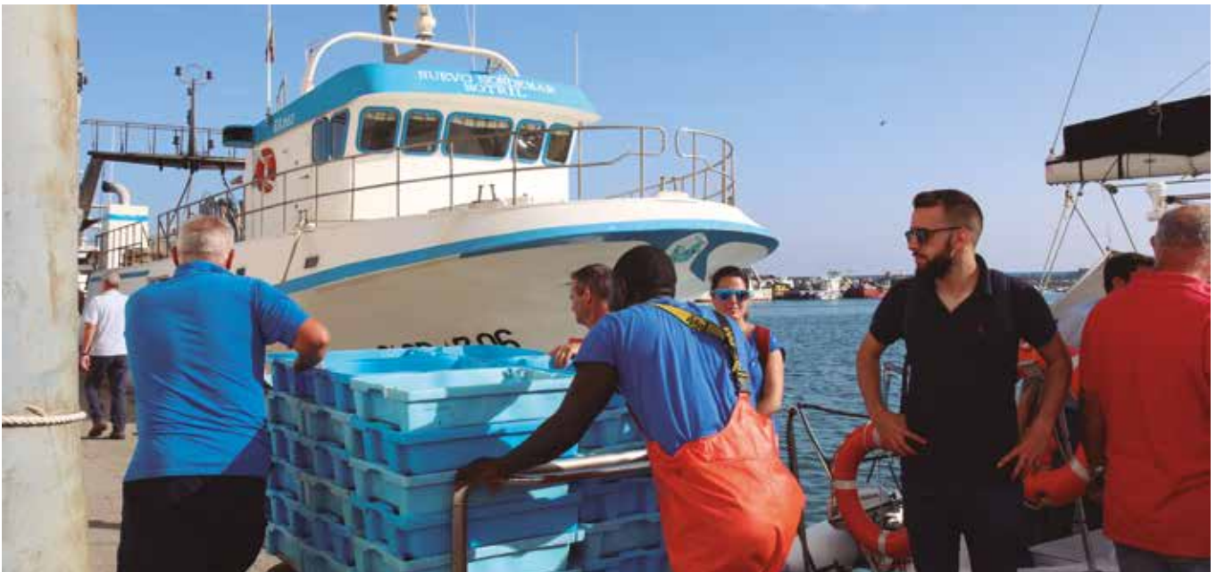
Descarga de pescado en el Puerto de Motril

Esa estrecha franja de la provincia de Granada con salida al mar está bien aprovechada. Es cierto que la pesca no es una actividad de gran peso en una región que obtiene sus rentas principalmente del turismo cultural, de playa y montaña y de la agricultura, pero la pesca es un hilo conector, un referente y un recurso laboral que siempre ha estado presente en la provincia.