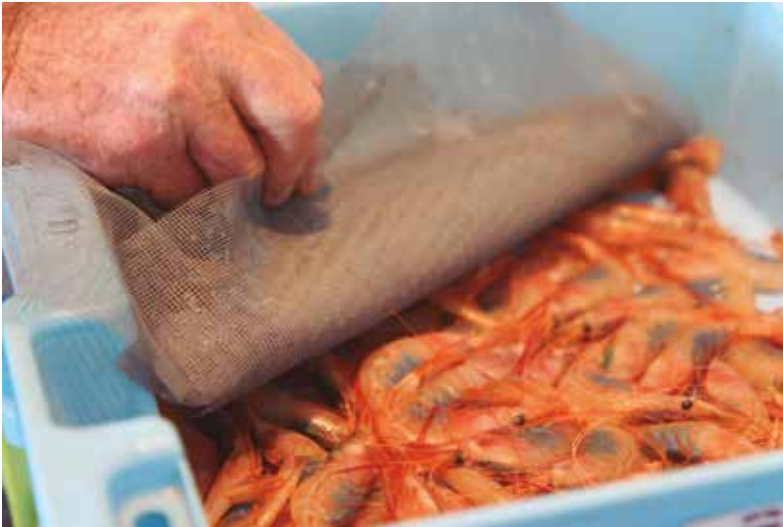
Las huevas azules son características de la quisquilla de Motril

pueden pescar con artes prohibidas en Europa y vendernos su pescado. Esto es tan injusto. Después de más de cuatro años preparando informes, todos han ido al cajón. Hemos peleado mucho y no ha sido posible”.