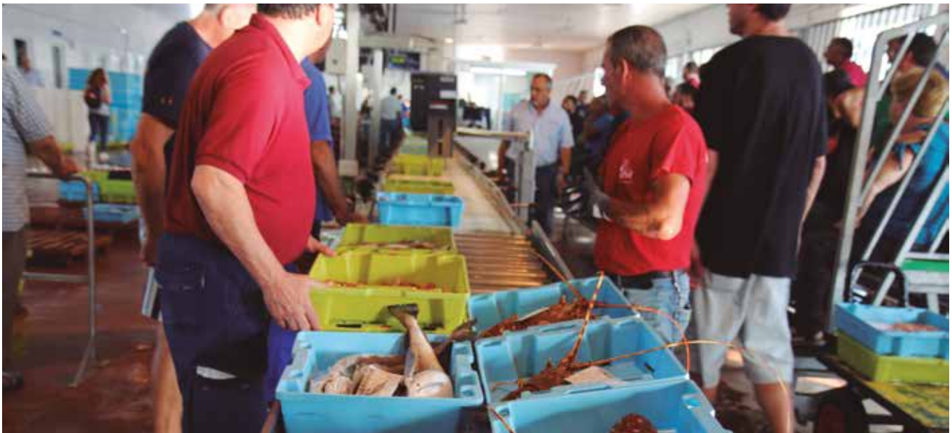
La subasta de tarde tiene mayor afluencia por ser multiespecie

se realizan dos subastas diarias, una matinal y otra vespertina, la que más afluencia concita al ser multiespecie. La lonja reporta una facturación anual de 5,4 millones de euros.